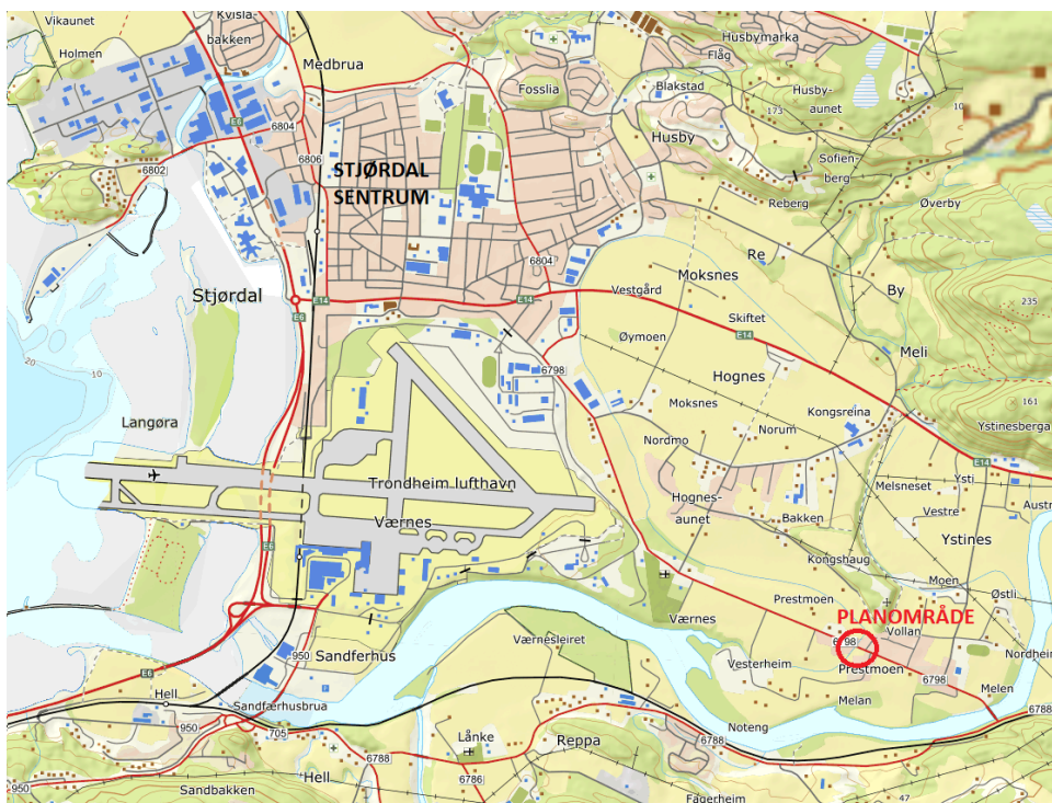
Figur 1 Oversiktskart med planområde