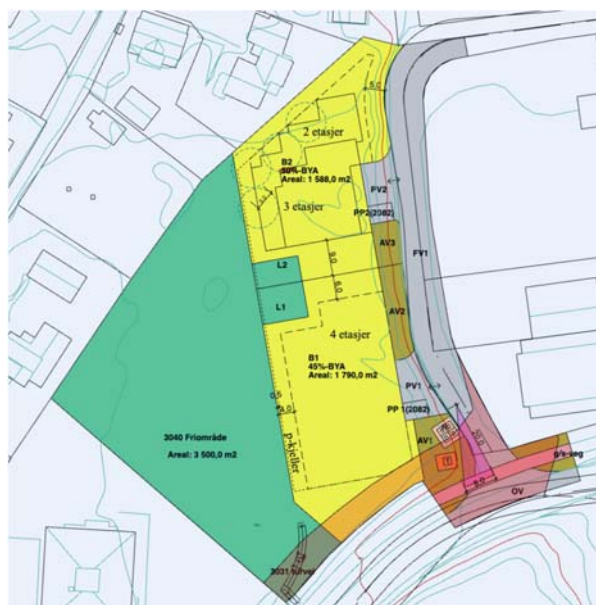
Skisse – justert plan