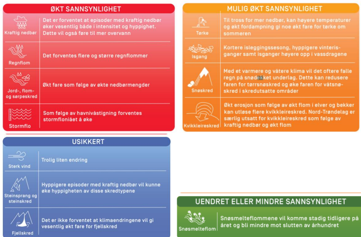
Figur 3.1 Sammendrag som viser forventede endringer i Nord-Trøndelag fra 1971-2000 til 2071-2100 i klima, hydrologiske forhold og naturfarer som kan ha betydning for samfunnssikkerheten [3].

Norsk klimaservicesenter har laget klimaprofiler (Figur 3.1) for alle fylker i Norge. Kort oppsummert vil klimaendringene i (Nord-) Trøndelag særlig føre til behov for tilpasning til kraftig nedbør og økte problemer med overvann, havnivåstigning og stormflo, endringer i flomforhold og flomstørrelser og skred. Det beregnes at årstemperaturen i Nord-Trøndelag øker med ca. 4,5 °C, og at årsnedbøren øker med ca. 20 % i løpet av århundret sammenliknet med perioden 1971–2000.