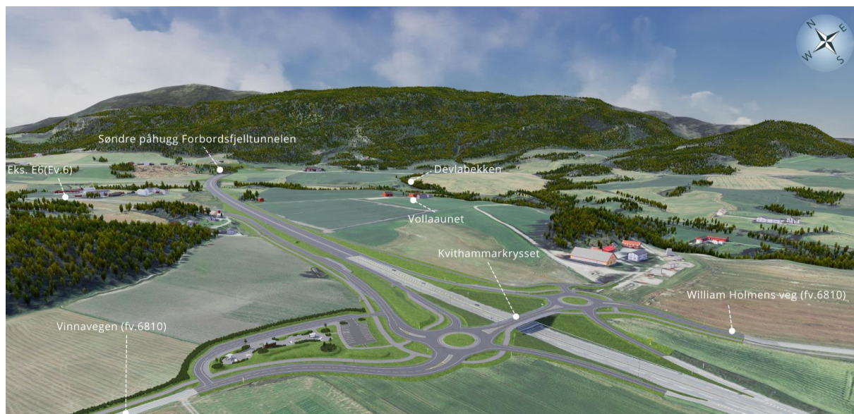
Figur 2.1 Planområde og foreslått reguleringsplan, Stjørdal – Dagsone Kvithammar–Holan

Som en konsekvens av planforslaget, blir dagens E6 nedklassifisert til fylkesveg. Ny E6 kobles til eksisterende vegnett i Kvithammarkrysset. Nedenfor vises bilde av planområdet fra dagsone Kvithammar til Holan (Figur 2.1) og dagsone i Langsteindalen (Figur 2.2).