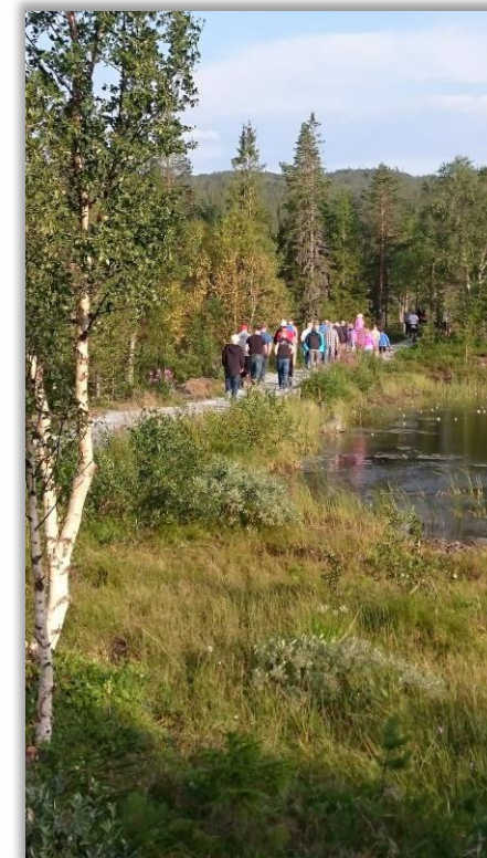
Figur 1 Brattbekktjønna

Stjørdal kommune ønsker å legge til rette for uformelle aktivitetstilbud og møteplasser for hele befolkningen gjennom hele livet, og har som mål at alle innbyggerne er fysisk aktive i tråd med nasjonale anbefalinger.