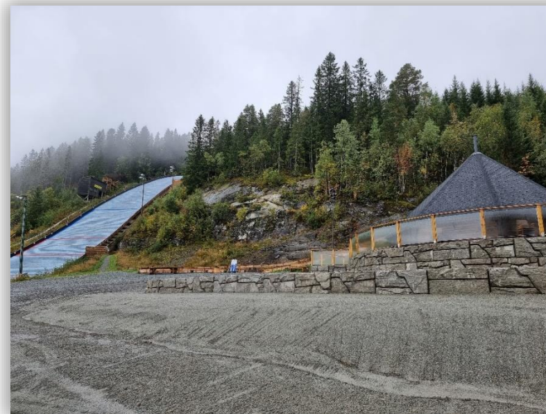
Figur 2 Bjørkbakken hopp-anlegg

aktiviteter på varmed.no . Dette brede spekteret av fritidstilbud viser at det er et mangfoldig og omfattende miljø for idrett og fysisk aktivitet i kommunen.