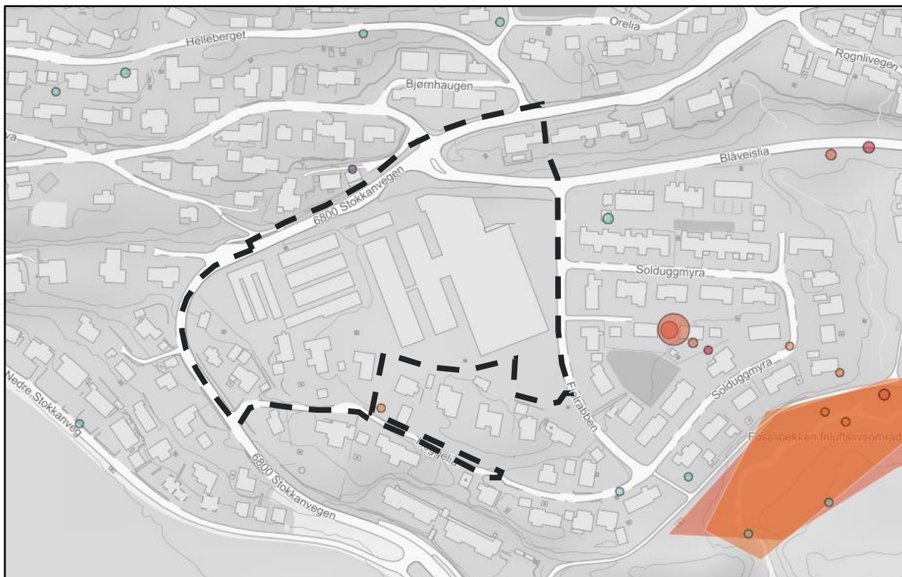
Figur 3-3: Kartutsnitt fra artsdatabanken.