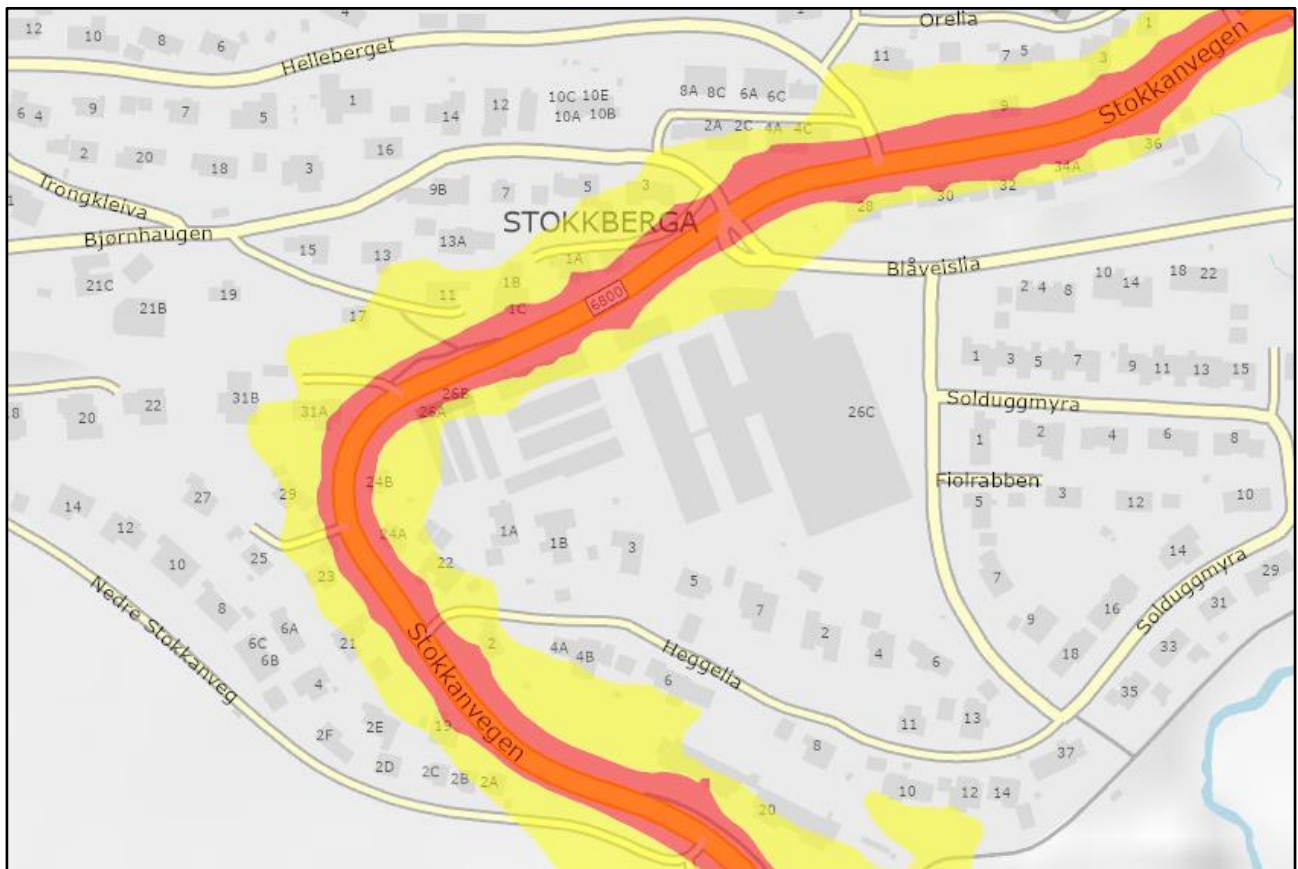
Figur 3-4: Utsnitt fra støysonekart til Statens vegvesen.