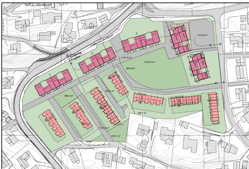
Figur 5-2: Alternativ 2 (Norconsult 2023)

Det er foreslått parkeringskjeller under leilighetene, men for rekkehusene åpnes det for direkte adkomst til boenhetene. Dette gir mer kjørbart areal innenfor planområdet noe som vil øke konfliktnivået mellom myke trafikanter og bilister, samt utfordre trafikksikkerheten. På lik linje med alternativ 1 er det foreslått innkjøring til p-kjeller fra Stokkanveien der dagens avkjøring eksisterer i dag. Ved full utbygging vil det være mulig å etablere ny rampe til parkeringskjelleren fra Fiolrabben.