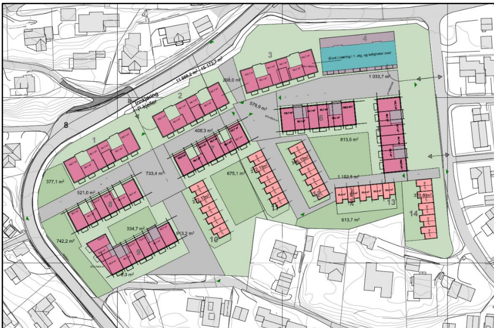
Figur 5-1: Alternativ 1 (Norconsult 2023)

Adkomst inn til området ved full utbygging vil skje fra Fiolrabben. Det er foreslått en midlertidig innkjøring til p-kjeller fra Stokkanveien.