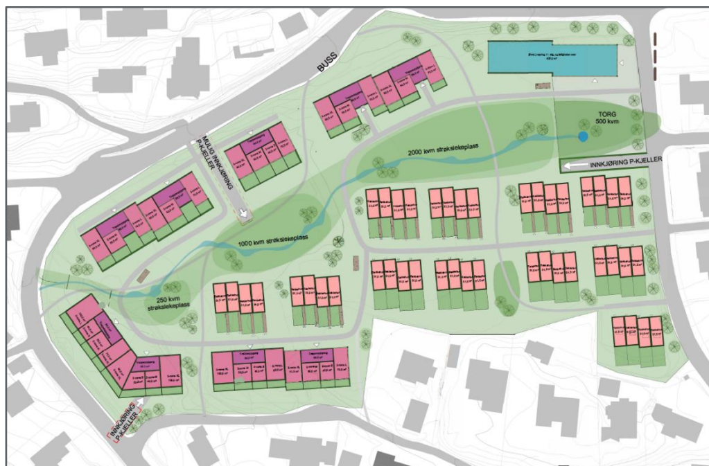
Figur 5-3: Alternativ 3 (Norconsult 2023)