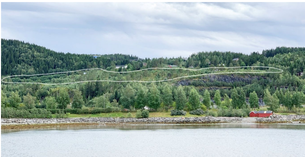
Figur 3: Bilde sett fra Hellstranda mot Gevingåsen og planområdet. Sett fra nord mot sør. Omtrentlig avgrensning av planområdet.