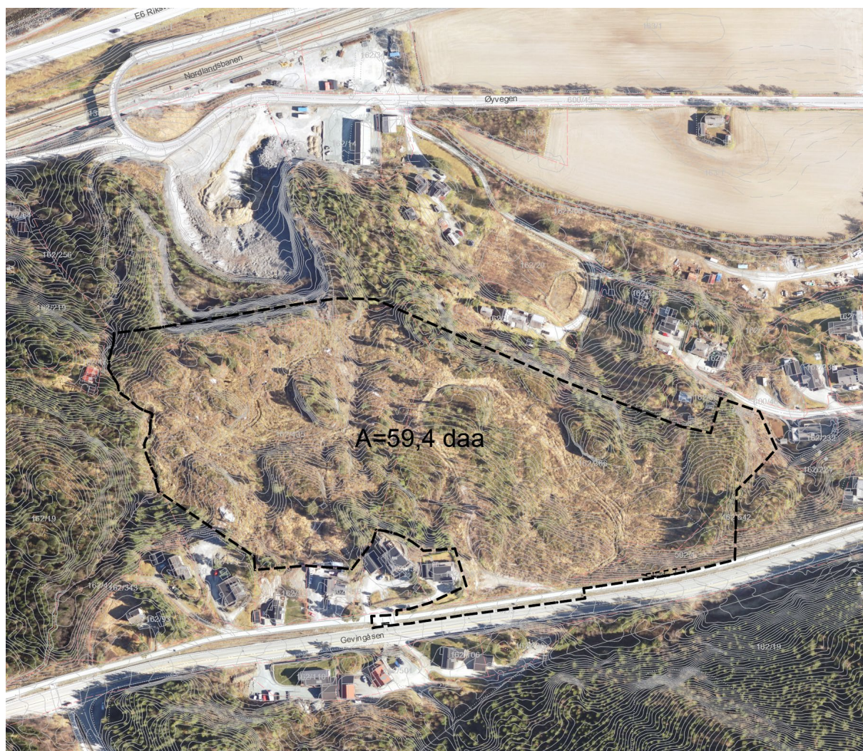
Figur 2: Oversiktskart med plankartavgrensning.

Utover dette er det mye ubebyggt og bratt skogkledt terreng i planområdets nærområder. I planens vestgrense går Kvernbecken. [2]