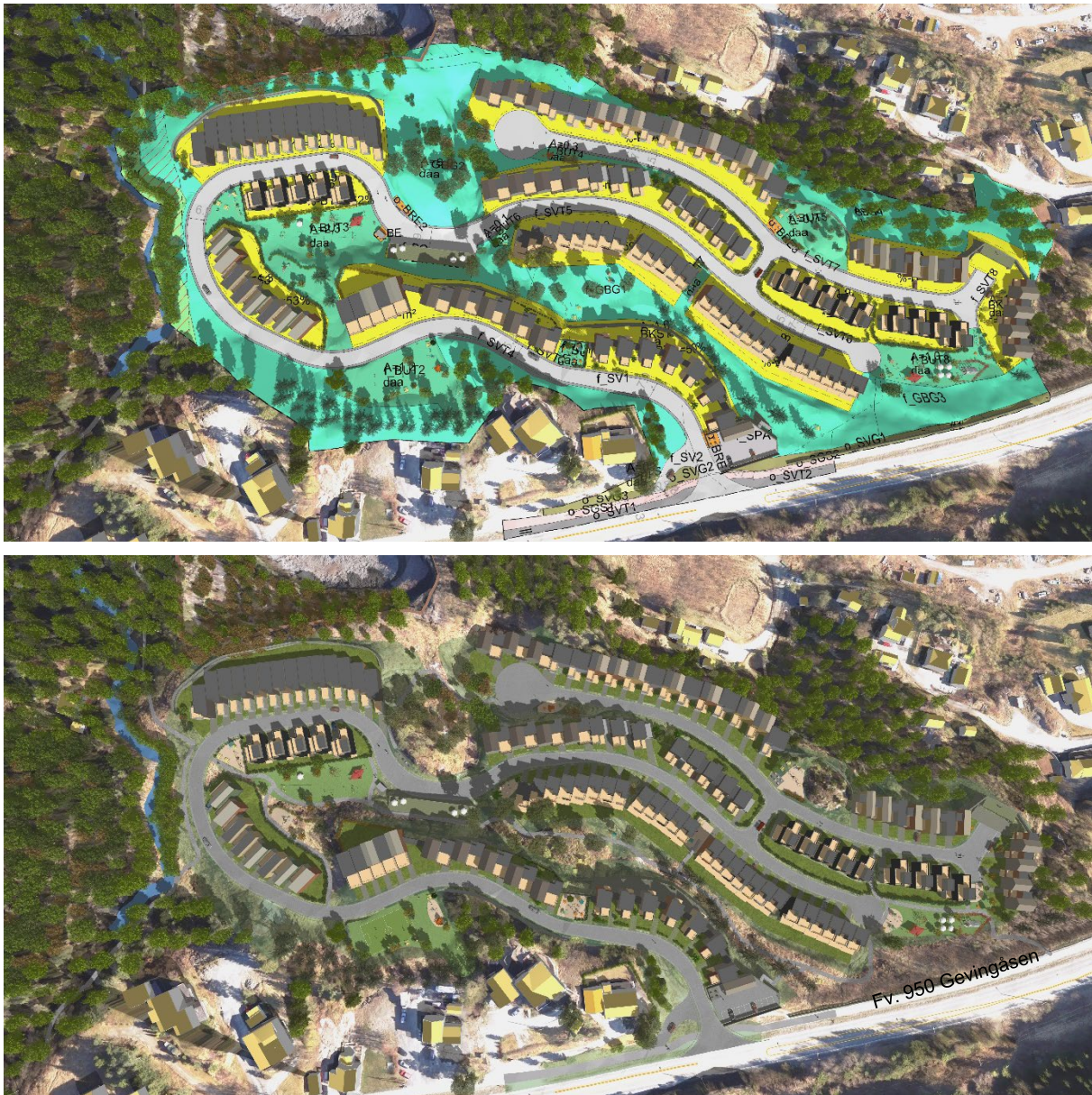
Figur 4: Oversiktsbilde fra prosjektets 3D-modell som viser foreslått utforming i planområdet. Illustrasjon øverst viser plankartet drapert på terrenget. [6]

Selve kjørevegen foreslås med en asfaltert bredde på 4 m. I tillegg kommer kjøresterk skulder som til sammen gir en minimumsbredde på 5,7 m for oppstilling av brannbil. Utenfor vegformålet er det regulert en sone med annen veggrunn – tekniske anlegg (f_SVT) med rom for snøopplag m.m. [5] [2]