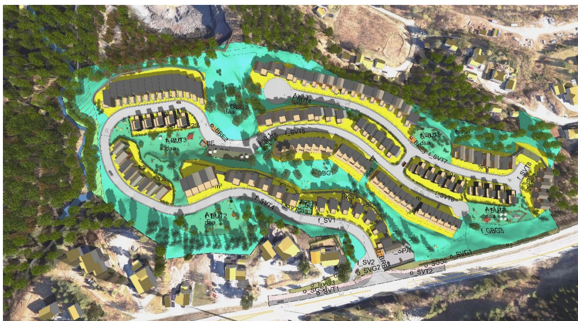
Planområdet med plankart og planlagt bebyggelse

Detaljregulering for Gevingåsen nedre GNR/BNR: 162/366 og 162/435 m.fl.